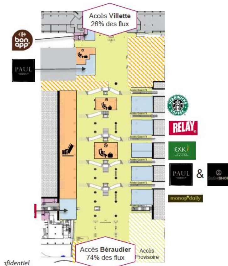
gare de Lyon (Projet « Part Dieu 2024 »)