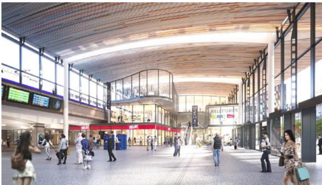
Perspective de la gare rénovée côté Béraudier Ouverture en juin 202